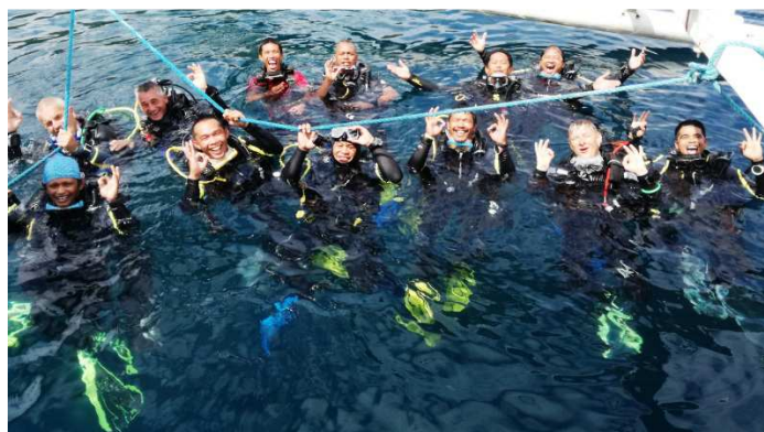
Fin des exercices