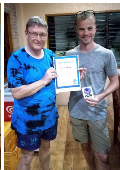
Merci à tous pour cette nouvelle mission réussie