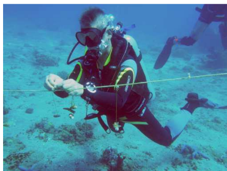
la French Line

De plus, ils y ont installé la « French Line » : Nouvelle ligne de boutures de coraux mise en place pour et par l'équipe de Plongeurs du Monde que nous verrons grandir.