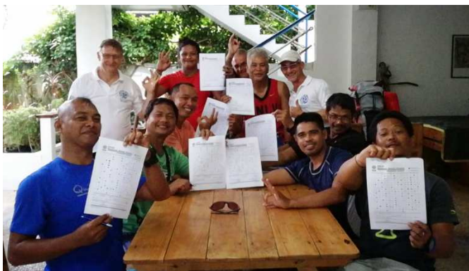
Examen réussi !