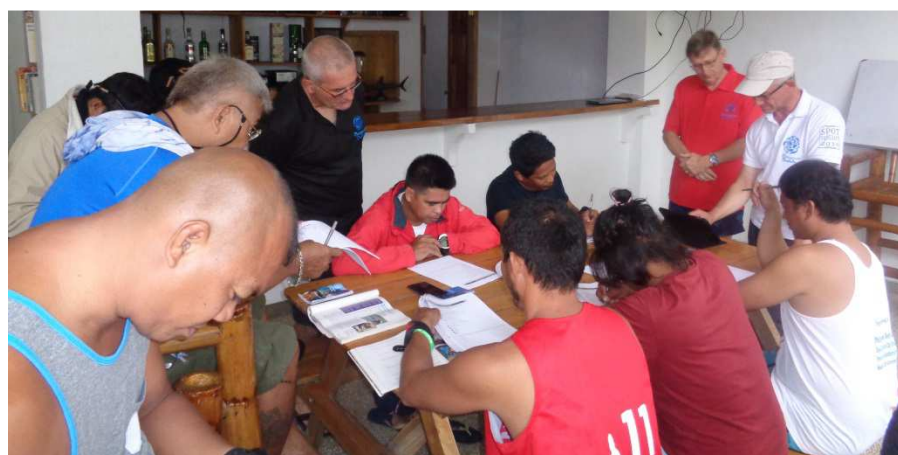
Ambiance studieuse pour les élèves

Entre la théorie des plongées jusqu'à 40m, la poursuite des exercices sous l'eau et les mises en situations d'urgence avec remontées de victimes sur le bateau, les élèves ont pris part à des simulations qu'ils pourraient rencontrer dans leur travail de secouriste ou comme gardes du parc marin.