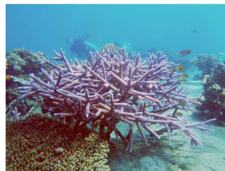
Après quelques années