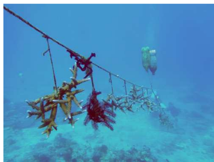
Laissons les grandir...