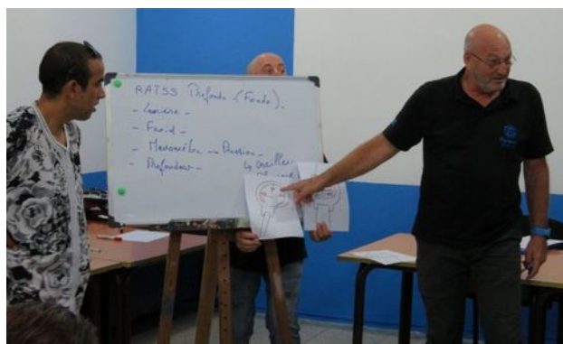
De l'importance du manomètre en plongée profonde, présentée à l'aide de la version Patéric de PowerPoint, devant un Majid médusé

Cette mission a été très productive. Nous avons eu de la chance avec les conditions météorologiques et nous sommes bien sortis des problèmes techniques et logistiques qui nous attendaient en embuscade au début du séjour. Nos plongeurs ont progressé grâce à notre mission, même si nous n'avons pas pu les emmener aussi loin que prévu. La convention signée avec ITPM permettra une meilleure implantation de Plongeurs du Monde au Maroc, en plus du prochain accord bientôt signé avec la toute jeune Fédération Royale Marocaine avec qui nous avons établi quelques contacts lors de notre séjour. Une affaire à suivre !