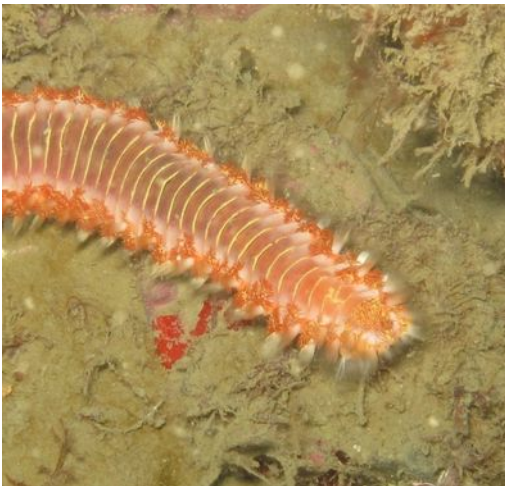
Un beau ver de feu