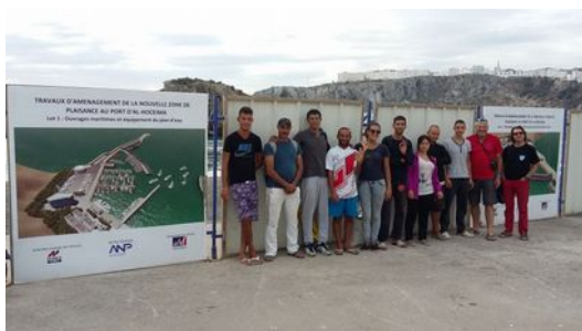
Toute l'équipe (encadrants et plongeurs) sur le site du Port

fera des souvenir. Toutes ces "corvées" donnent lieu à des grands moments de solidarité, d'entraide et de rires, rien de tel pour former de bons plongeurs.