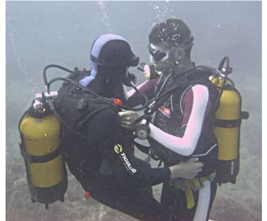
Exercice de remontée assistée