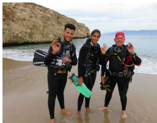
Prêts pour une plongée à Cala Bonita

Les bouteilles sont gonflées, le site de plongée est défini : Cala Bonita en face du club de plongée et la digue du port, yapuka : il n'y a plus qu'à faire vider les bouteilles par nos plongeurs. Mais au fait, où sont-ils ? Ont-ils retenu les leçons de la mission dernière ? Sont-ils toujours motivés ? Heureusement, mercredi soir nous les retrouvons presque tous, la plupart ont répondu présents puisque nous composerons cette année un groupe de 6 Prépas-PE40 et un groupe de 3 Prépas-PA20. Nous retrouvons avec plaisir des têtes connues, nous regrettons qu'il en manque mais c'est la vie. Nous leur expliquons l'organisation prévue des plongées, cette année différente du fait de l'utilisation d'un bateau (nous y croyions à ce moment). Nous leurs donnons rendez-vous pour le lendemain 9h pour les PE40 et 15h pour les PA20.