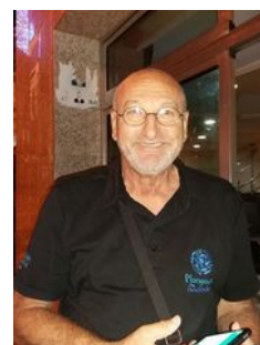
Louis... re-beau !