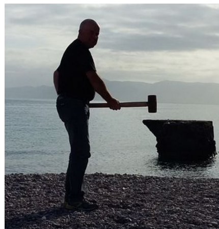
C'est en forgeant en contre-jour...