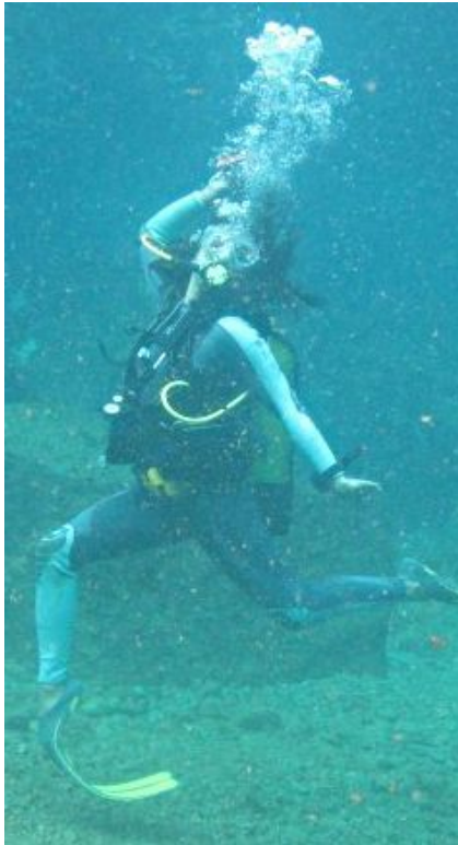
Ce vidage de masque n'est pas dans le manuel mais quel style !