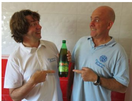
Tout ça c'est pour nos Pom's !