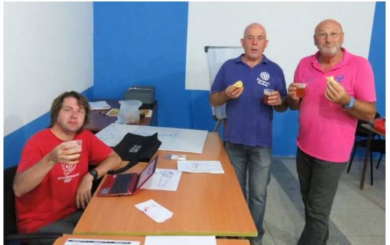
Les encadrants en démonstration de thé...orie de la plongée profonde et conviviale