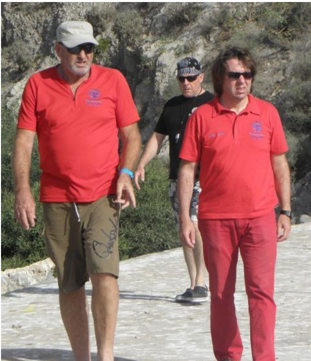
Men in red (and black!)