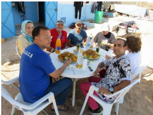
Couscous sur la plage