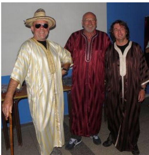
Les encadrants paradant à la cérémonie des diplômes

notre mission, autant dire qu'on était très nombreux. Chaque plongeur diplômé a reçu un petit cadeau de la part de Plongeurs du Monde et les trois encadrants ont eu également droit à une surprise : un habit traditionnel marocain dans lequel ils ont paradé jusqu'à la fin de la cérémonie, tellement ils étaient fiers.