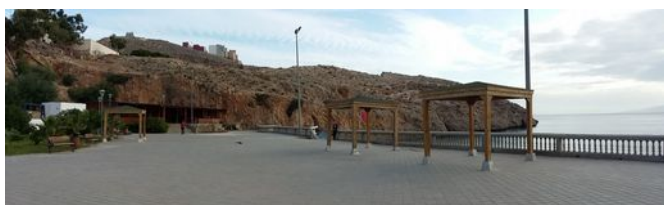
La digue de Cala Bonita

A partir de ce moment, les plongées se mettent en place suivant un rythme régulier, les "grands" le matin, les "petits" l'après-midi. Ils n'ont rien perdu de leur enseignement des deux années précédentes, ils sont toujours à l'aise, c'est impressionnant quand on sait qu'ils n'ont pas plongé pendant un an. Les cours de théorie le soir ponctuent nos journées et sont