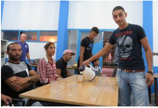
Cérémonie du thé