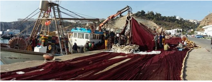
Pêcheurs au travail sur le port