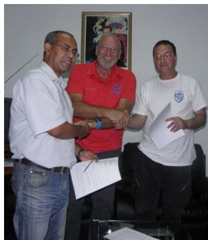
C'est signé !