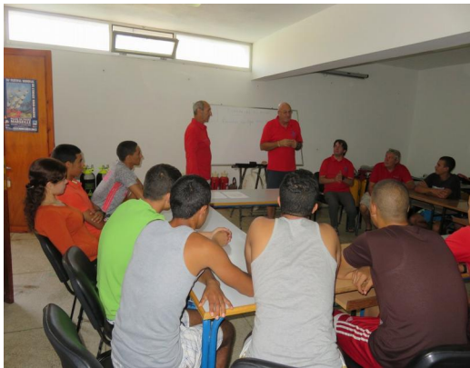
Présentation de la formation