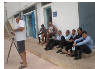
La théorie au soleil, c'est quand même plus agréable