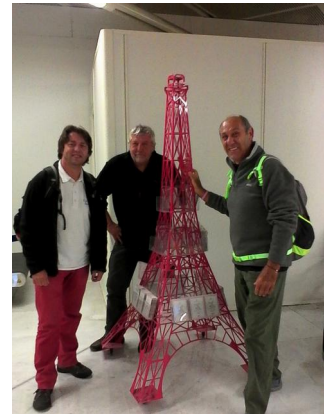
Arrivés à Orly, nous n'avons pas résisté à cette photo !