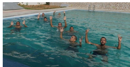
Vérifions l'aisance dans l'eau : Haut les mains !

consacrée à la vérification de l'aisance aquatique de nos stagiaires, ce n'a pas été simple pour tous de tenir 10 minutes dans l'eau sans aide. De même, les huit longeurs en nage libre furent l'occasion pour nos cow-boys d'apprendre à ménager leur monture. Bravo, avec plus ou moins de facilité, tous nos stagiaires ont prouvé leur aquaticité, on va pouvoir commencer la formation proprement dite, ça tombe bien, les bouteilles doivent arriver le lendemain. En attendant, nous consacrons l'après-midi à la première section de théorie. La soirée nous donne l'occasion de redécouvrir "la oficina", le bar où nous avons nos habitudes l'année dernière pour effectuer nos débriefings (entre moniteurs et