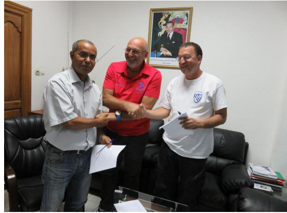
Signature de la convention en 2015