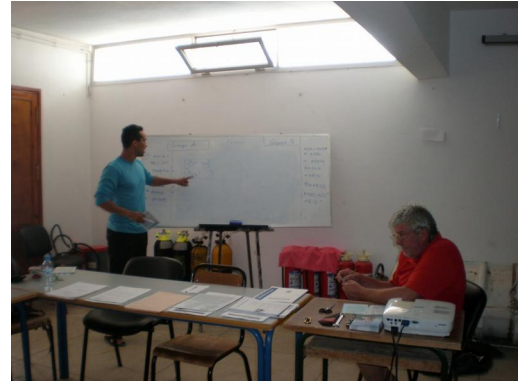
Briefings d'avant-plongée et séances de théorie se succèdent (y compris en faisant plancher nos stagiaires au tableau !)