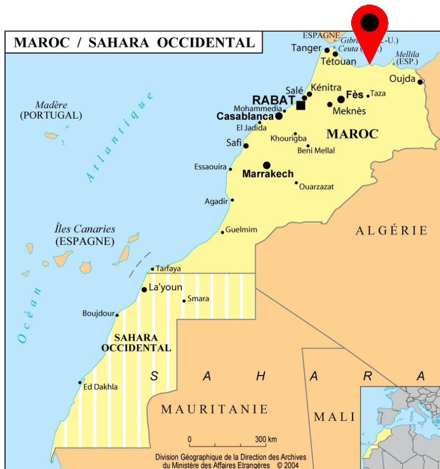
Situation d'Al Hoceima